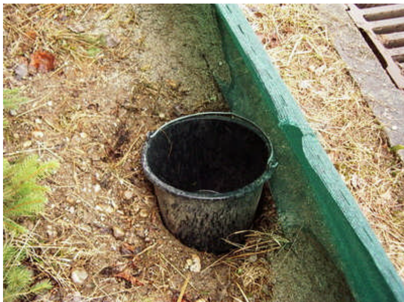
Abb. 2: Ein sehr nachlässig eingegrabener Eimer.